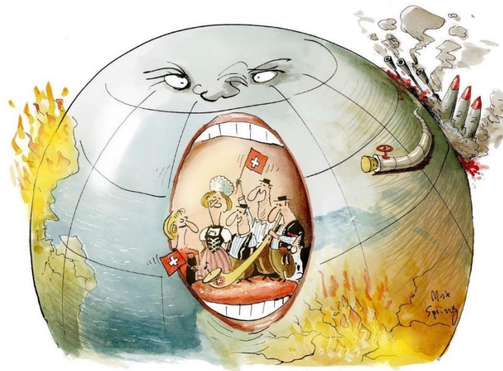
Max Spring / Berner Zeitung / Die Schweiz steht vor bitteren Aufgaben

Es ist also höchste Zeit – und die Schweiz hat die Mittel dazu, wenn sie will –, die Frage der digitalen Souveränität anzugehen. Wenn wir weiter warten, besteht die Gefahr, dass unser Land schnell und endgültig nicht mehr in der Lage ist, seine immateriellen (Daten, Informationen, Werte/Kultur, usw.) und materiellen (Materialien, Infrastruktur, Herstellungsverfahren, Verwaltung der Informationsflüsse, die für das Funktionieren der menschlichen Aktivitäten unerlässlich sind, usw.) Interessen zu wahren.